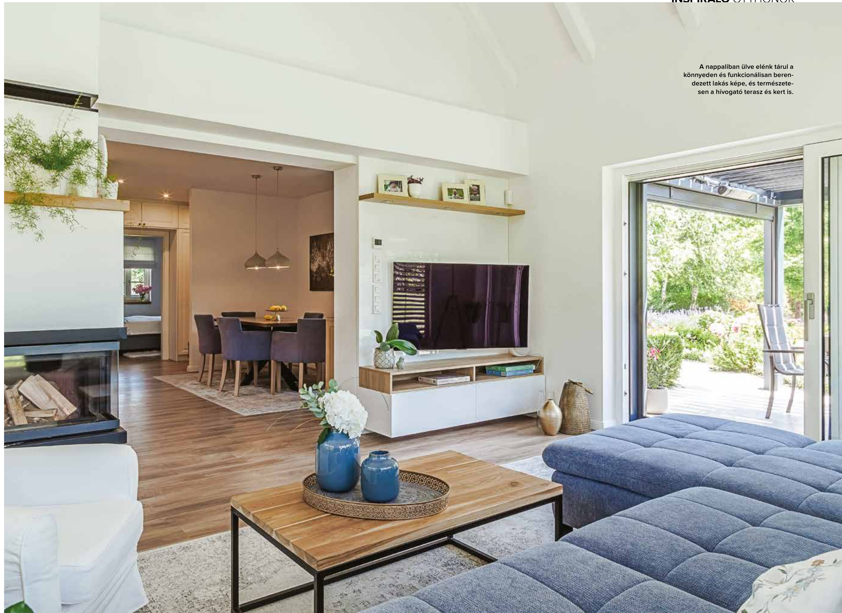
A nappaliban ülve elénk tárul a könnyedén és funkcionálisan berendezett lakás képe, és természetesen a hívogató terasz és kert is.

Imádtam ezt a megbízást, a közös munkát, a családot, a csodás kertet, azt, ahogy élvezik az új házat és a mindennapokat, ahogy szeretnek itt élni. ♦